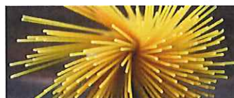
( https://www.wired.it/scienza/lab/2018/spaghetti-spezzarli/ )

LAB ( HTTPS://WWW.WIRED.IT/SCIENZA/LAB/ ) - 18 AGO