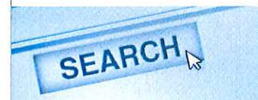
( https://www.wired.it/attualita/media/2018/08/06/m-ricerca-online/ )

( HTTPS://WWW.WIRED.IT/TOPIC/AUGMENTE-PREZETTI-MEDIA/ )