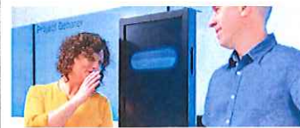
( https://www.wired.it/ai-intelligenza-artificiale/storie/2018/08/10/ibm-lai-puo-ragionare-dibattere-gli-esseri-umani/ )

ARTIFICIAL INTELLIGENCE (/AI-INTELLIGENZA-ARTIFICIALE)