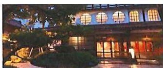
( https://www.wired.it/economia/business/2018/08/20/pepsi-acquista-sodastream/?refre... ) aziende-piu-antiche-mondo-attive/